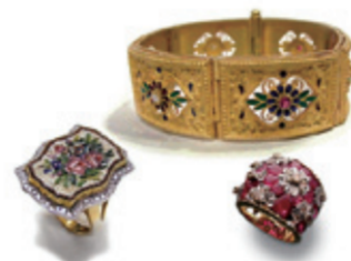
AGEMINA GIOIELLI S.R.L.(イタリア)