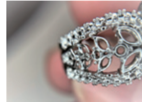
PT サンプル、買通していない 穴もしっかりとキャスト

SUZUHOがジュエリー用に監修したXYZ社製ノーベルスーパーファインプラスは、昨年からの販売が好調です。リース/ローンの参考価格は月々約12,000円〜と、CADユーザーが外注費用をはるかに下回るケースが多く、CADユーザーに一台という夢のような時代を築いています。さらには低価格で簡単に小型、SK電子の高周波小型鋳造機の登場で、小さな工場や工房でも、台所感覚で原型製造から鋳造、製品に仕上げるまでを実現しました。これにより従来では考えられない投資で製品化までの歩留まりも一気に上がることも想定できます。詳しい内容は是非SUZUHOブースまで足をお運び下さい。