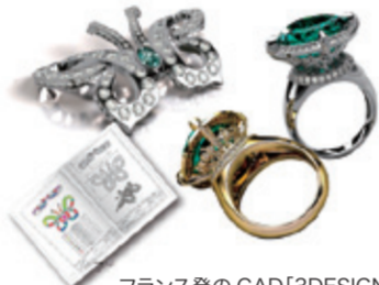
フランス発のCAD「3DESIGN」は、世界でも類を見ないジュエリー専用のCADソフト、そのレンダリング画像は本物さながら

近年大きく業界を変えたCAD/3Dプリンターはさらに使用する幅が広がります。従来の製造ツールから販売ツールへと大きく変化します。会場では、急速に低価格になった3Dプリンターや業界唯一のフランス製 ジュエリー専用CAD「3DESIGN」の展示・販売はもとより、これからCADや3Dプリンター(造形機)がどんな方向にどう変化をしていくのか?欧米ではどんな展開を見せているのか?今後業界にどのような影響を与えていくのか?さらには近年のCADの進化や3Dプリンターの現状なども加えて、実践的な画面やパワーポイントを使って時間を分けたセミナー等を行います。※要予約