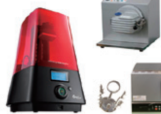
XYZ ノーベルスーパー ファインプラス 3Dプリンター

価格もある程度買やすいラインにまで落ちてきた3Dプリンターにおいて、機械の性能はある程度成熟してきた今年の大注目、その周辺材料の重要性に目を向けていただきたい。SUZUHOでは長年光造形方式の3Dプリンターの販売をしてきたノウハウから、様々な樹脂を開発中。近年は消耗品としての樹脂の消費費用も膨大なものとなり、価格的にメリットの出る新樹脂なども登場するので、是非お試しください。