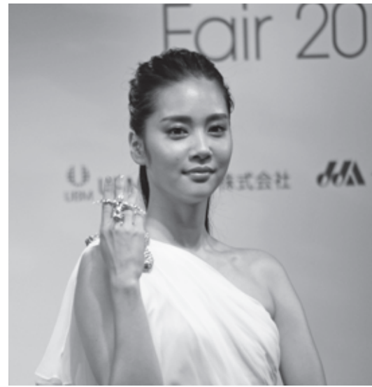
ファッションショーなどを見て五感を養う

ステージでは、ジュエリー最高峰を決めるJJAデザインアワードやジュエリーファッションショーが連日開催され、エンターテインメント性も見どころの一つ。