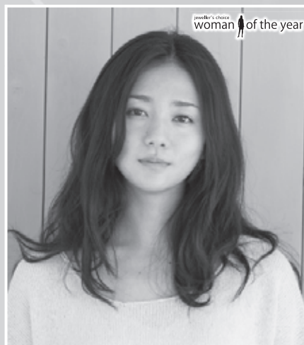
ジュエリー業界が選ぶ「第5回「ウーマンオブザイヤー」表彰式」女優の木村文乃さんがイベントステージに登場!