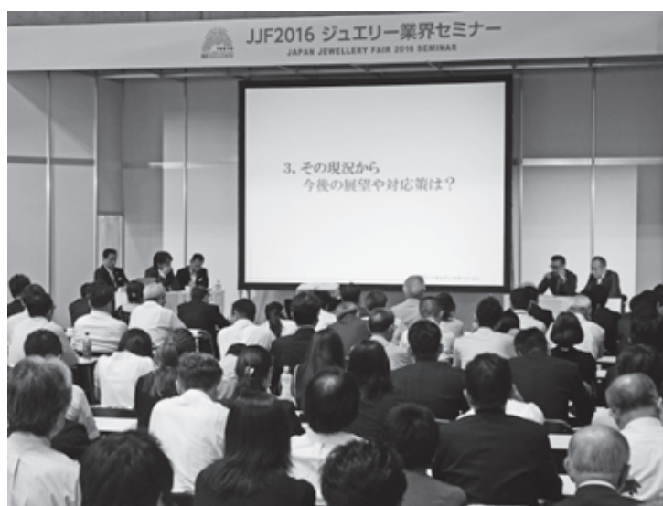
様々なプログラムで学べる

グループとしては、ICA、アーチザン・ビレッジ、アトリエグループやまなみ、ジュエリータウンおかちまち有志、ジュエラズクラブセレス、全国宝飾商協同組合、東京ジュエリーディーラーズ、日本ジュエリーデザイナー協会、日本真珠輸出入加工協同組合、日本宝飾協同組合有志、プロジェクトFなどと多彩だ。