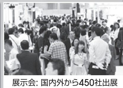
展示会: 国内外から450社出展