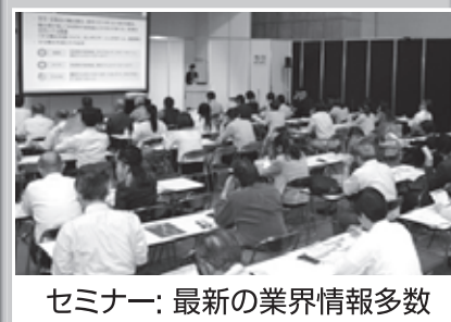
セミナー: 最新の業界情報多数