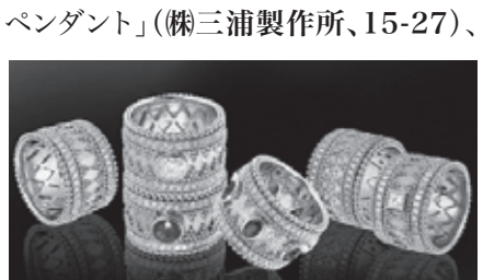
MODA ITALIA「Granulata Collection」

村田宝飾株式会社 URL http://www.murata-jewelry.co.jp E-mail info@murata-jewelry.co.jp