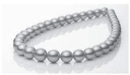
東京真珠「金色連とルース」

村田宝飾株式会社 URL http://www.murata-jewelry.co.jp E-mail info@murata-jewelry.co.jp