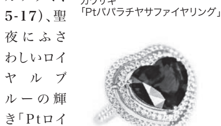
カワサキ「Ptババラチヤサファイヤリング」

12-5)、色が濃くテリの良いナチュラル「金色連とルース」(東京真珠(株)、2-12)、希少価値の高い「甘いピンクのサファイヤを愛らく花のリングにした、Ptババラチヤサファイヤリング」(株カワサキ、5-17)、聖夜にふさわしいロイヤルブルーの輝き「Ptロイヤルブルーサファイヤリング」(株ジュエリーブランニング、7-5)、カジュアルにも