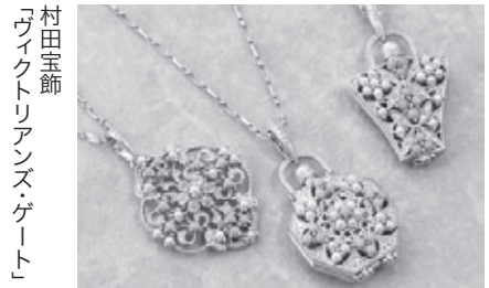
村田宝飾「3Dチェスターペンダント」