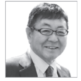
第31回日本メガネベストドレッサー賞 経済界部門 似鳥昭雄氏 (ニトリホールディングス会長)

毎年話題となる、「第31回日本メガネベストドレッサー賞」の受賞者には、政界部門=石井啓一氏(国土交通大臣)、経済界部門=似鳥昭雄氏(ニトリホールディングス会長)、文化界部門=加藤綾子氏(フリーアナウンサー)、芸能界部門=豊川悦司氏(俳優)、サングラス部門=ダレノガレ明美(モデル/タレント)、特別賞=モーニング娘。'18(選抜メンバーが出席/アイドルグループ)が決定しており、注目されている。