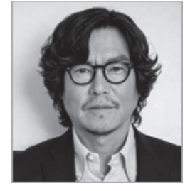
第31回日本メガネベストドレッサー賞 芸能界部門 豊川悦司氏 (俳優)