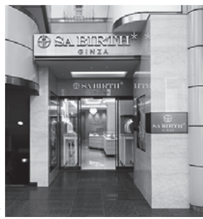
サバース ギンザ 銀座本店

より一層クラスアップするコーディネート提案をできるラインナップを揃えた。注目は、「世界最高峰の瑞々しい輝き エシカルダイヤモンドのサバース」として、天空の王国「LESOTHO(レソト)」で誕生した世界最高品質のダイヤモンドの、“貴石の旅の物語”を提案していることだ。