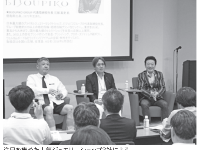
注目を集めた人気ジュエリーショップ3社によるパネルディスカッションの様子

たいのか、買いたいのかなどを、わからない人が多い」と指摘。そして花路では「宝石は永遠性がある。思いや温もり、輝きを、贈る人・着ける人、お求めになる人の心の輝きを表現するものという考えを、会社のテーマの真ん中に置いている」と説明。加えて「その人が着けた時に輝いているのは、その人の心の輝きや思いを表現していること」と表