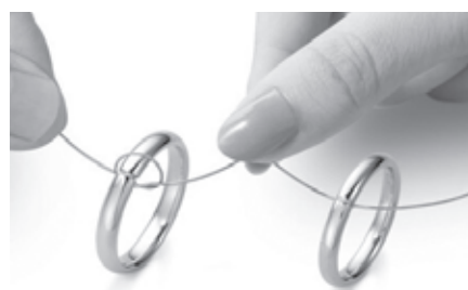
オーダーメイド企業の(株)ケイ・ウノ

1月22日13時30分から、国際宝飾展IJTの会場、日本ジュエリー協会が主催のセミナーとして装飾用合成ダイヤモンドの生産状況、品質、価格などについての現状と動向について、(株)中央宝石研究所リ