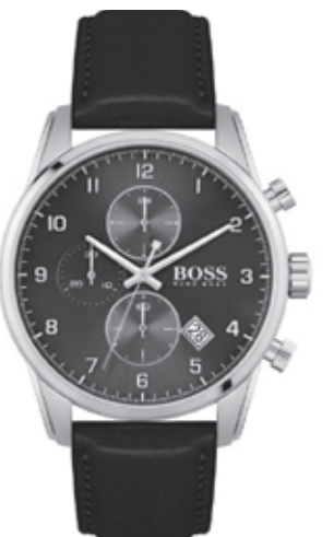
栄光時計(株)が取り扱う「HUGO BOSS」の2020新作モデル「SKYMASTER」コレクションが全国のユーゴ・ボス正規取扱店で発売され、ヴァンテージテイストと高級感あふれるデザインがカッコ良いと注目を集めている。

栄光時計(株)が取り扱う「HUGO BOSS」の2020新作モデル「SKYMASTER」コレクションが全国のユーゴ・ボス正規取扱店で発売され、ヴァンテージテイストと高級感あふれるデザインがカッコ良いと注目を集めている。新作は、飛行機の操縦士を思わせるダイヤルデザインで、空へのアドベンチャースピリットを表現する。パリエーションは、シックなブラックダイヤル×SS製ケースと、上品なネイビーダイヤル×ラグジュアリーな印象のゴールドが大人の装いを演出している。価格はブラックダイヤル:4万1000円+税、ゴールドカラーケース:4万8000円+税。