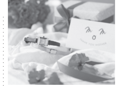
腕時計のセレクトショップ「TiCTAC」は、女性向けのオリジナルブランド「SPICA」(スピカ)の「母の日限定セット」を4月27日よりオンラインストア先行で限定発売している。

腕時計のセレクトショップ「TiCTAC」は、女性向けのオリジナルブランド「SPICA」(スピカ)の「母の日限定セット」を4月27日よりオンラインストア先行で限定発売している。『SPICA』は乙女座の一等星の名を付けたTiCTACのオリジナルブランド。自分らしくおしゃれを楽しむ女性に向けた、ジュエリーのようなデザインが特徴だ。発売しているのは「SPICA」