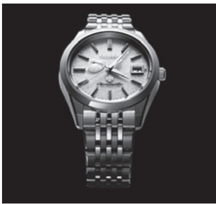
白い砂浜に忘れ貝がひとつ優しく輝く風景を文字板に描いている。モデル名は「はまべ」第三節に登場する「真砂」から名付けた。

のエコ・ドライブムーブメントを搭載し、日本三大和紙のひとつ「土佐和紙」と白蝶貝を文字板に採用。光発電エコ・ドライブに適した透過性と薄さに加え、独特の風合いをもつ素材同士を組み合わせた高級感のある文字板が特長。またデザインは、歌人 林古溪(はやしこけい)作「はまべ」に着想を得たもので、9時から10時位置にかけて配置した充電量表示部分にのみ白蝶貝を使用し、