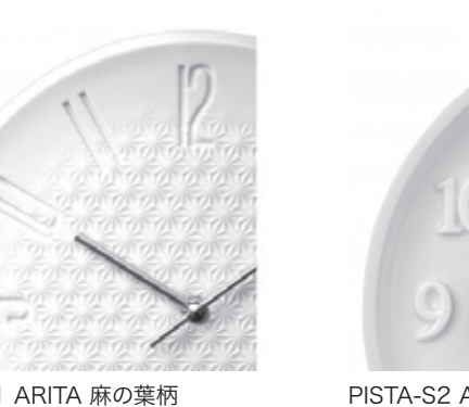
PISTA-S1 ARITA 麻の葉柄

技を活かしながらもモダンさを感じさせる逸品となっている。「PISTA-S1 ARITA」麻の葉柄で表現される美しい白磁は、池田製陶の優れた職人技で実現。その透けるような白い磁肌と滑らかな上質な光沢感において、数