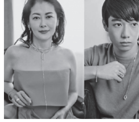
ラボグロウンダイヤモンドのみを使

PRMALは、日本発の地球環境に優しいラボグロウンダイヤモンドを採用した、未来につながるエシカルファインジュエリーブランド。天然ダイヤモンドと見た目も成分も同じラボグロウンダイヤモンドのみを使用し、生産から販売までをコントロールすることで無駄なコストを徹底的に排除。最適価格でジュエリーをより身近な存在にすることを目指している。