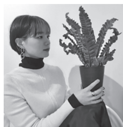
ミスキ:植物集めとインテリアと中華料理が好き。@mizu024