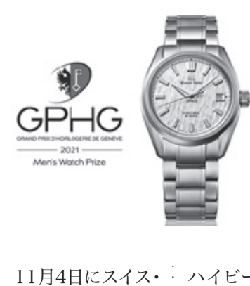
11月4日にスイス・ハイビート36000GMT限定モデル

ジュネーブ市で開催された「2021年度ジュネーブ時計グランプリ」において、グランドセイコーのSLGH005(1,045,000円)が「メンズウォッチ」部門賞を受賞した。グランドセイコーとしては、2014年度の「メカニカル