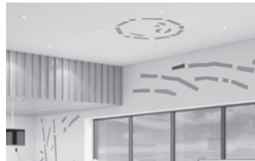
下がり天井の富士檜とモチーフイラスト

さらに、地域の人々にJINSをより身近な存在と感じてもらいたいと、下がり天井や店内のボックス型のスツールには、地元富士市原産の富士檜(ひのき)を採用。また、富士市は富士山麓からの豊富な湧き水に恵まれ、「紙のまち」としても知られることに着目し、商品棚の引き出しなどには、従来の木材ではなくコットンパルプや精製木材パルプでつくられた強化紙を使用している。