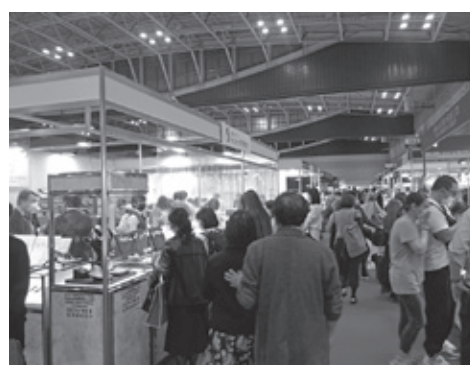
人々、来賓・特別招待者などだ。

来場対象者は、宝飾小売、百貨店、メーカー、卸、デザイナー、通販・ネットショップ、ハンドメイド作家、インフルエンサー、宝飾品ビジネスに関心ある