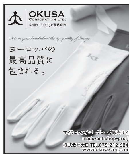
マイクログリーンテクノロジー採用 Trade-At-Shop-Pr-010 株式会社大日 TEL:075-212-6840 www.okusa-corp.com

スター公式オンラインストア・with ORIENT STAR限定で発売される。シリーズ最新作は、自然を連想させる落ち着いたグレイッシュなアースカラーのグレージュとオリーブの2モデル。柔らかいカラーリングはリラックスした雰囲気を与えながらも金属の質感がプラスされ、上品で洗練された印象。テキスタイルをイメージした2枚重ねのダイヤルは、ファッションのコーディネートに色調や明度を変えることで「レイヤードスケルトン」独自の立体感を演出する。