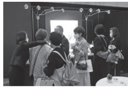
舟車盛雄コーナー