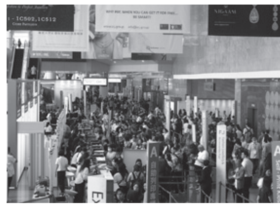
賑わいを見せた国際色豊かなJGW

世界最大の宝飾見本市「Jewellery & Gem WORLD Hong Kong (JGW)」が、長期化されたパンデミックから復活し、2019年以降の大規模展として9月18日~24日までの7日間、香港で開催された。