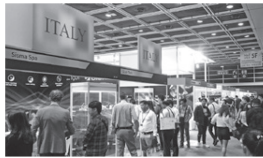
際立つ各国のパビリオン

世界最大の宝飾見本市「Jewellery & Gem WORLD Hong Kong (JGW)」が、長期化されたパンデミックから復活し、2019年以降の大規模展として9月18日~24日までの7日間、香港で開催された。