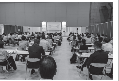
日本真珠輸出入加工協同組合によるセミナー

は、彼の飽くなき挑戦があるからこそ。正解のない時代だからこそ、チャレンジすることが大事であり、特に大御所になればなるほどチャレンジする人を応援すべきことに気づきたい。そして誰もが愛される人柄の大切さを日本人は彼から学んでいるはずだ。