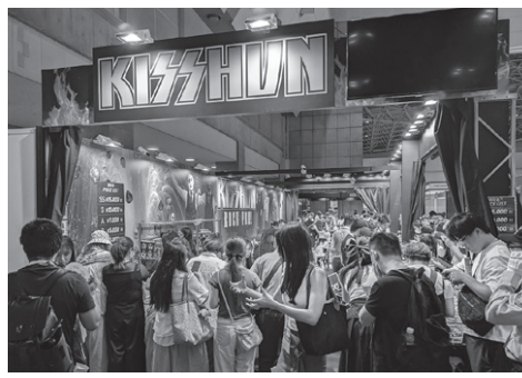
いつも賑わう「真鯛」。時代に合わせた設置も。

感じられるような雨はどうか降らなかったが、台風の上陸が早かった九州地区や関西方面からの関係者たちが多少はいたようでも、早くからキャンセルした人も多く、JJFを訪れたとしても早々に引き上げねばならないほど、台風の影響は広範囲に及んだ。また、JJFに影響を与えたのは台風に限らず、8月8日に発表された南海トラフ地震臨時情報(巨大地震注意)により国内の消費活動が萎縮し、旅行関連消費が2000億円程度減少したといわれる通り「地震」による影響は海外にも伝播し計り知れないものがあった。