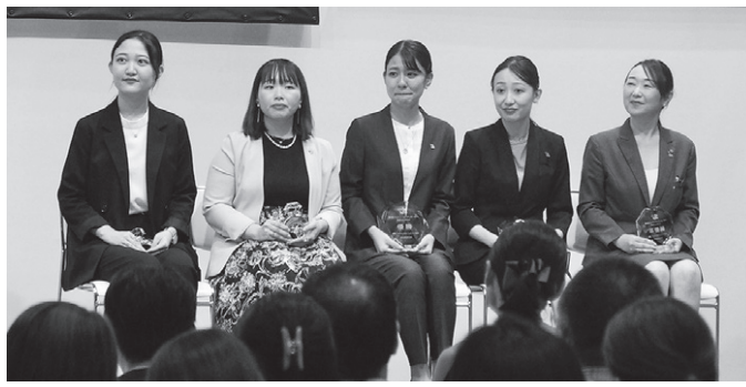
JC接客コンテストファイナリストの皆さん