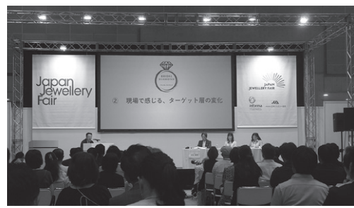
JJAパネルディスカッション

と一般社団法人日本ジュエリー協会(JJA)との共同プロジェクトである。BtoBに特化したJJFに