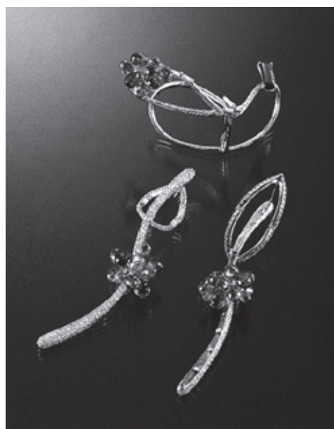
準グランプリ・経済産業大臣賞／日本 ジュエリーデザイナー協会会長賞／プ ラチナ・ギルド・インターナショナル賞

デザイナー: 沢村つか沙 製作者: 今与アトリエ室／応募者: 樹今与 作品名: 「Black&White-見えないものを観る」